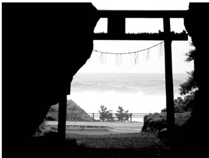
(写真1) 神明洞内からみた風景

『国遍礼霊場記』には「此地は、むかし大師求聞持勤修あそばしける所なり。大師みづからかかせ給ふに、土佐室戸門の崎にをいて寝然として心に観ぜしかば、明星口に入、虚空蔵の光明照らし来て、菩薩の威を顕はし、仏法の無にを現すと」と述べられている。求聞持法とは、虚空菩薩の真言「オン・バサラ・アラタンノウ・ソワカ」を1日1万遍を100日かけて誦するきまりになっている。五来（2009）は求聞持の場所には①真言を繰ること、②行道をすること、③聖火を焚くことの三つの条件が必要であるという。また、最御崎寺は「火つ御崎寺」といわており、火を焚くところであり、つまり海を神様にする海洋宗敎行の場所がこのあたりで、これを「 へ 辺地」といった。藤田（1996）は山岳宗敎が起こる以前、海に囲まれた国に住む私たちの宗敎意識は、海の方こうに注がれおり、海を拝みながらの修行の系譜が古来からあったという。沖繩・奄美には「ニライカナイ」という常世の国があると言われてきた。それは豊穰や生命の源であり、他界が海の方こうにあり、生者の魂も死者の魂はニライカナイより来て去っていき、祖霊が守護神へと生まれ変わる場所であるという信仰が今でも残されている。図2の室戸岬の遍路道を見てみると、土佐の修行の道場が海岸線に沿っており、各札所が海洋宗敎とつながっていたことが分かるのではないだろうか。